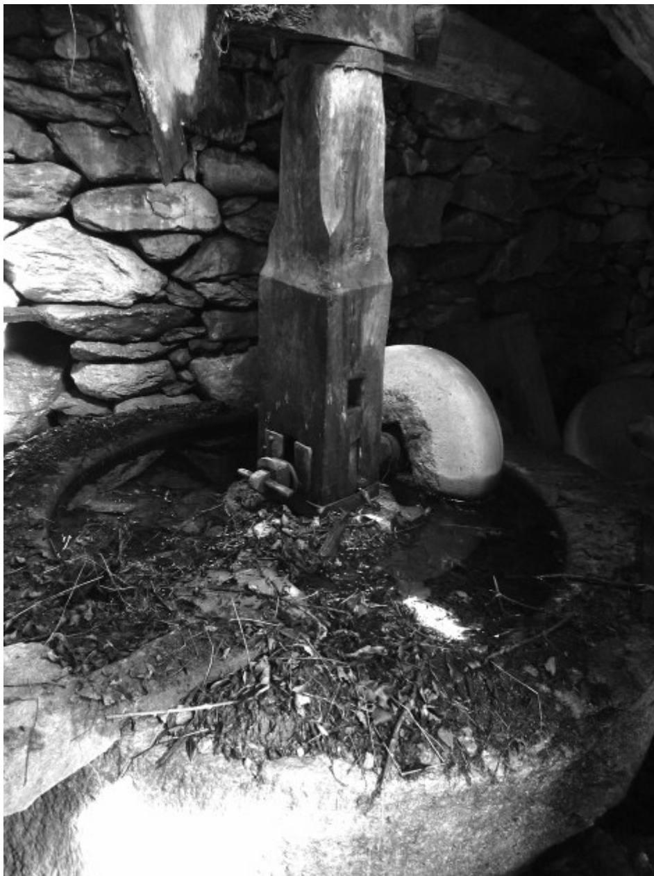
Fig. 10) La pesta da canapa dei Mulini di San Colombano, a Exilles.