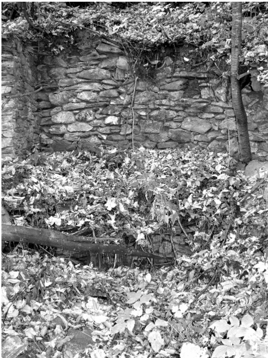
Fig. 12) Rovine della pesta da canapa d'Inverso, a Beaulard. Questi edifici erano spesso meno curati degli altri opifici e la loro pianta più irregolare. Sovente i muri avevano un andamento semicircolare, come in questo caso, e seguivano il perimetro della camera delle acque, anch'essa circolare.